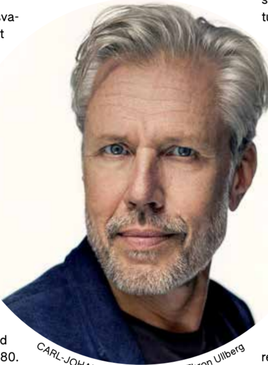
CARL-JOHAN VALLGREN.

„Kingitus“ on satiiriline romaan keskonnaküsimustest, pagulaskriisist ja kultuuride põrkumisest. Selles jõua-