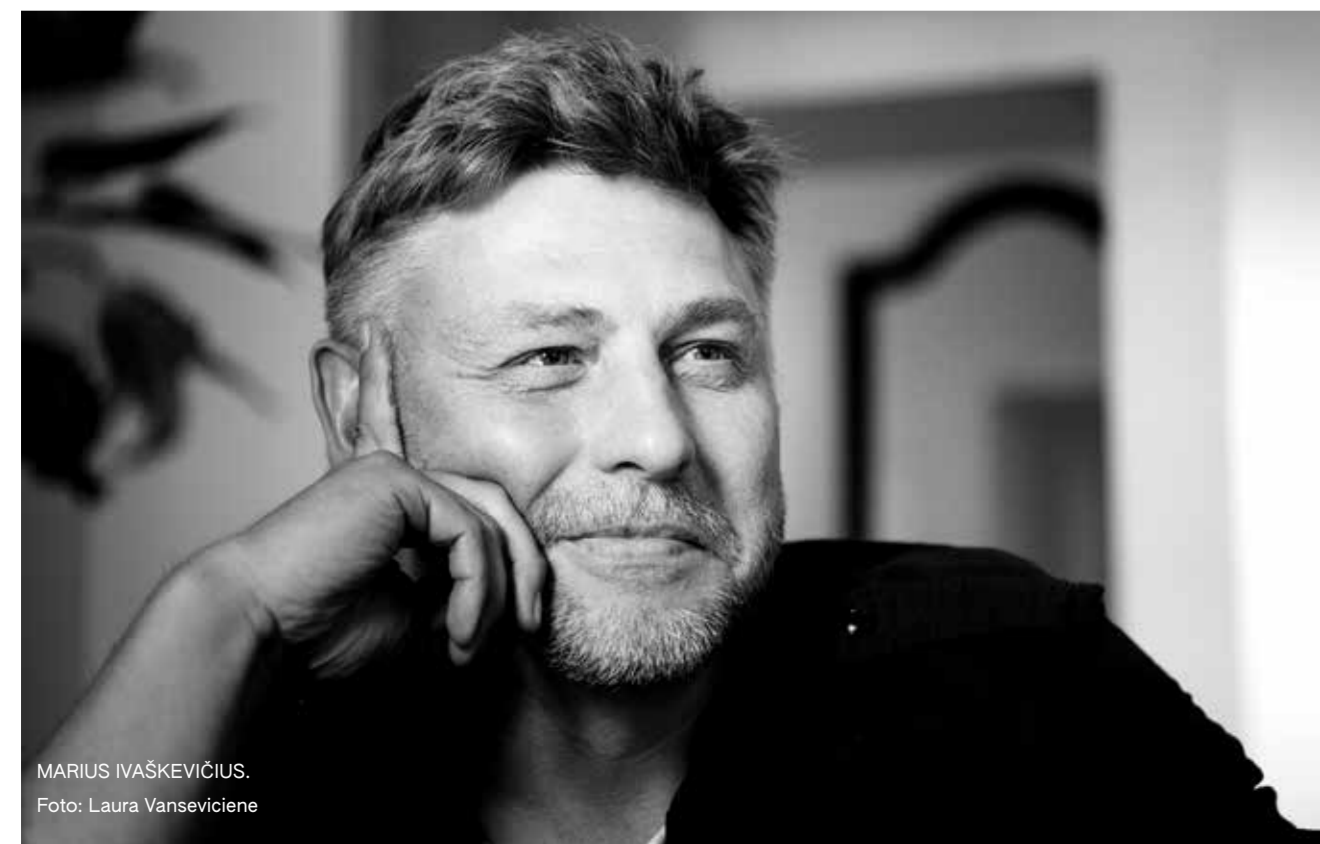
MARIUS IVAŠKEVIČIUS.