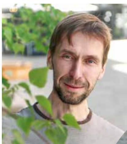
ANTI SAAR.