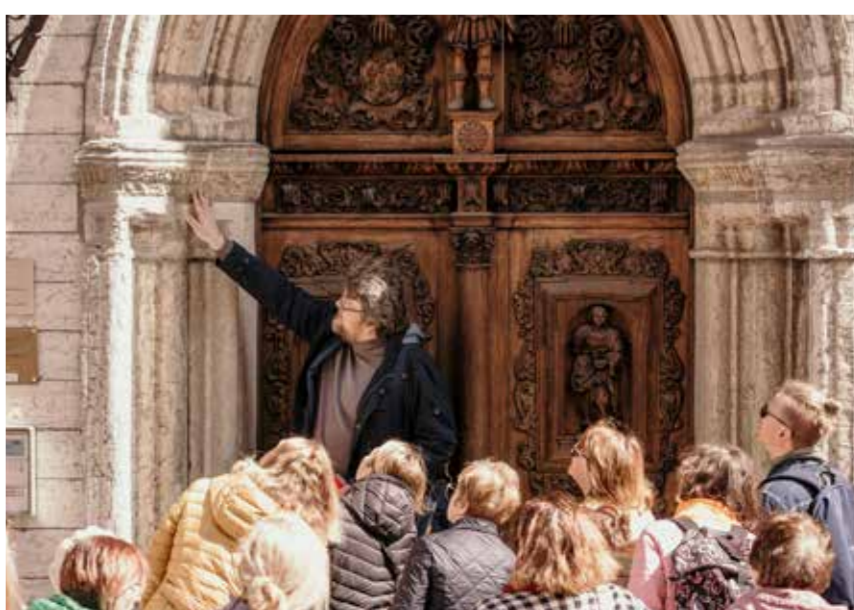
HEADREAD 2023.

Filmid kirjanikest on üks neist viisidest, kuidas kirjandus filmi ja film kirjandusse pääseb. Poola režissöör Agnieszka Holland ekraniseeris 2025. aastal Franz Kafka eluloo. Holland püüab eemaldada müütide kihte, mis ümbritsevad XX sajandi üht populaar-