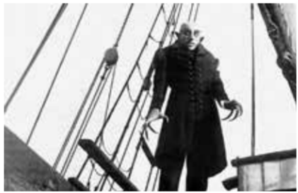
KUVATÖMMIS FRIEDRICH MURNAU FILMIST „NOSFERATU“ (1922)